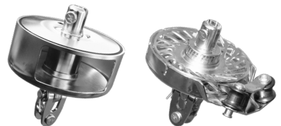
Abbildung zeigt Baugröße II